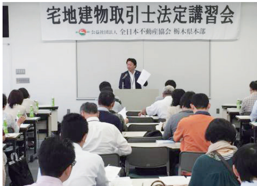
分かりやすい講義に受講者から高評価